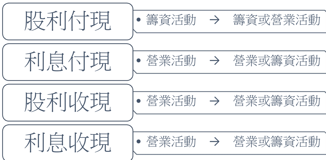
圖 2.我國與 IAS.7 的基本差異

其中利息與股利之分類判斷，應以各期一致之方式分類為營業、投資或籌資活動。對金融機構而言，通常將支付之利息及收取之利息與股利分類為營業現金流量。惟對其他企業而言，此類現金流量之分類方式並無共識。由於支付之利息及收取之利息與股利為損益決定之一部分，故得分類為營業現金流量，但由於其為取得財務資源之成本或投資之報酬，因此亦得分別分類為籌資現金流量及投資現金流量。由於支付之股利為取得財務資源之成本，故得分類為籌資現金流量。惟為幫助使用者決定企業以營業現金流量支付股利之能力，支付之股利亦得分類為來自營業活動現金流量之組成部分。