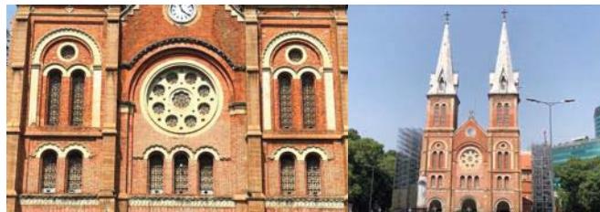
圖 2 西貢聖母大教堂