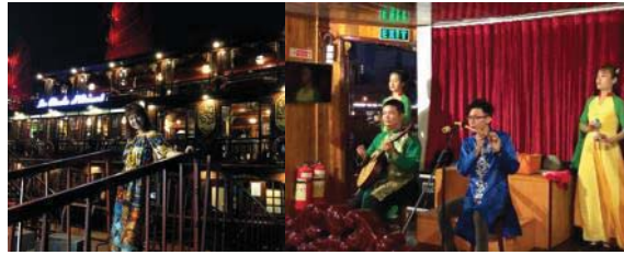
圖 9 西貢郵船