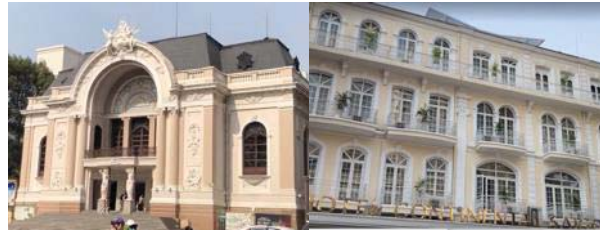
圖 3 胡志明市大劇院

產：產業主要為藝文表演等為主要項目，街道上有高級精品與商家零售和咖啡廳等，但缺乏其藝文活動所延伸之核心產業，例如街頭藝術家、駐村藝術家、戶外文創市集等，產業內容太過於封閉性，文旅渲染力上較為薄弱。 景：擁有雄偉的法式風格建築，建築外觀上保存得相當良好，具備了歷史意義與古典特色。