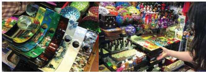
圖 1 濱城市場