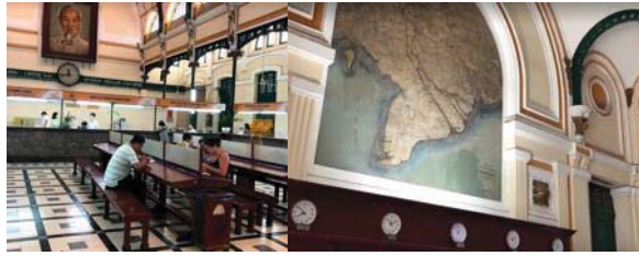
圖 6 中央郵局