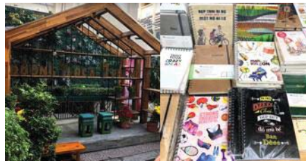
圖 7 書街