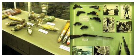
圖 5 戰爭博物館

景：博物館有大型軍用戰車、砲台、飛機等，未來可以建立屬於自己的博物館 IP 向外宣傳擴散或成為地方的藝術裝置。