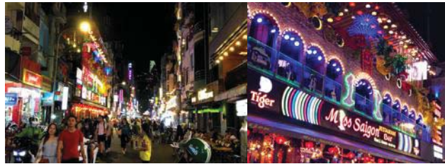
圖 4 范五老街