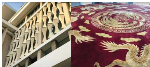
圖 8 統一宮